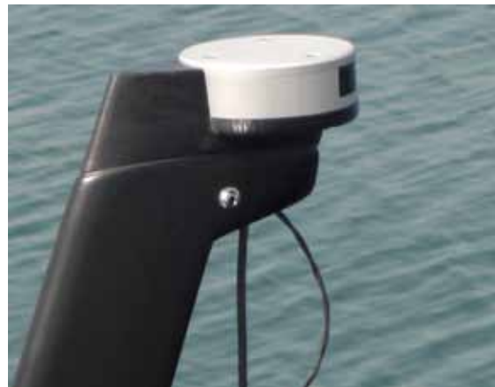
SUPPORTO RADAR RADAR HOLDER